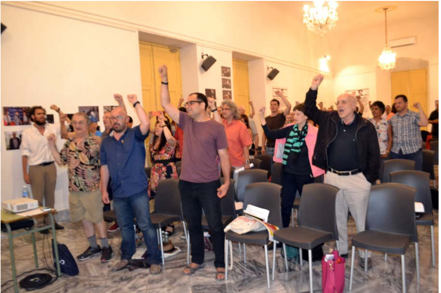
Abschluss der Konferenz in Havanna.

Die Texte der in spanischer oder englischer Sprache für den Kongress geschriebenen Beiträge, von denen einige nicht vorgetragen wurden, werden in absehbarer Zeit in Havanna in Buchform veröffentlicht. Hier folgt eine Übersicht der Autoren und ihrer Themen.