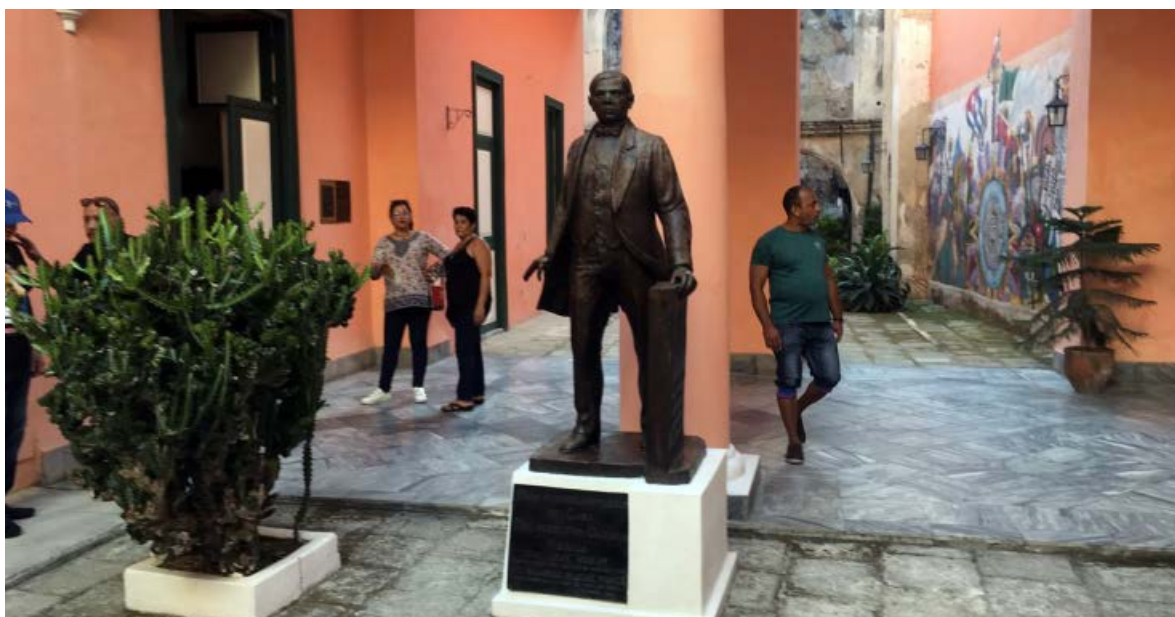
Der Tagungsort, das Museo de Benito Juárez in Havanna.