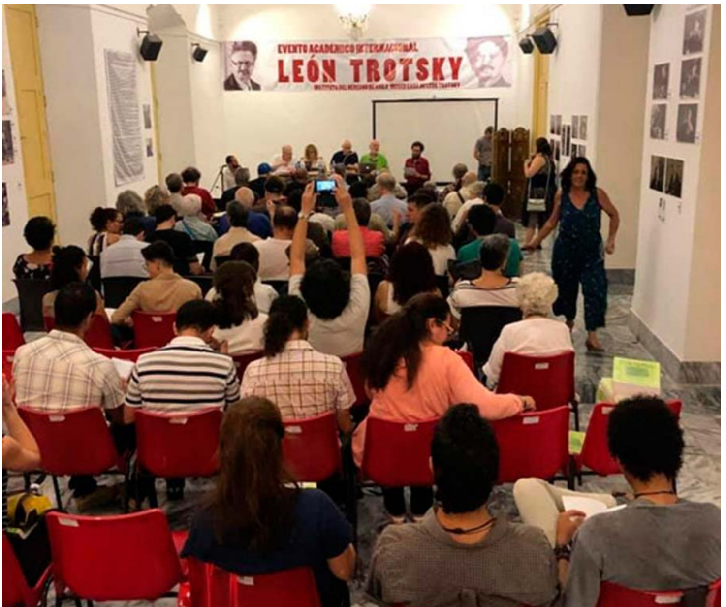
Plenum Trotzki-Konferenz in Havanna.