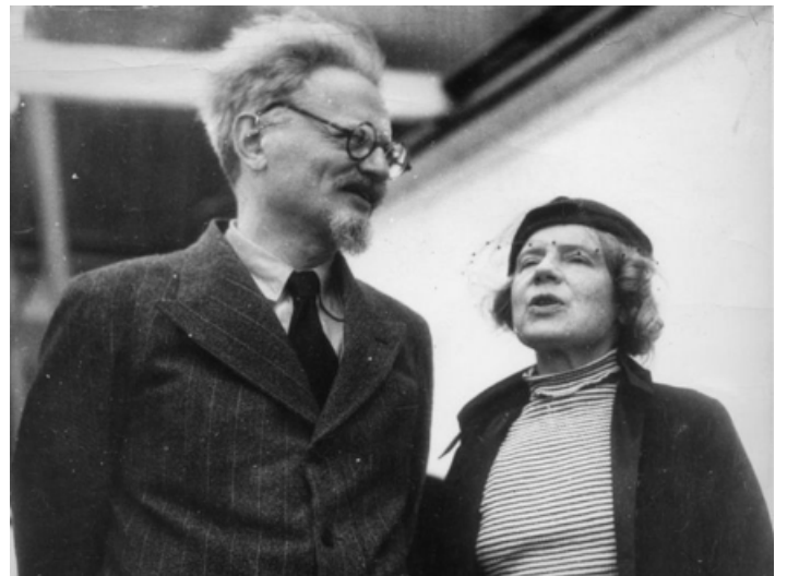
Natalia Sedowa und Leo Trotzki in Mexiko 1938.

Der ungeheure Schatten des Stalinismus 2 lag (und liegt noch immer) über vielen Versuchen, aus dem Bannkreis der kapitalistischen Weltwirtschaft auszubrechen.