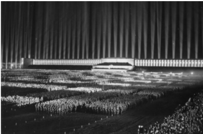
Nazi-Parteitag 1936 in Nürnberg.

Reich sprach von einer „Schere“ zwischen Ökonomie und Ideologie – oder auch zwischen dem empirischen oder Alltags-Klassenbewusstsein auf der einen und dem der Arbeiterklasse von Theoretikern und Parteiführern „zugerechneten“ oder „zugeschriebenen“ Bewusstsein auf der anderen Seite. Geiger wie Fromm führten sie auf ungleichzeitige, träge „Mentalitäten“ oder „Sozialcharaktere“ zurück. Ihnen zufolge verhinderten sie eine einfache „Übersetzung“ der ökonomischen Interessenlage in ihr entsprechende politische Optionen.