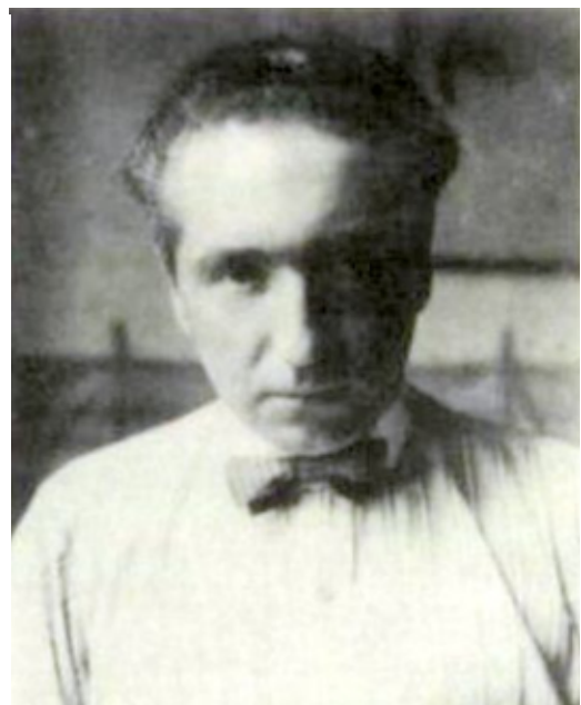
Wilhelm Reich ca. 1922.

Reichs „sexualökonomische“ Interpretation des (antisemitischen) Massenwahns und des Führer- und Gemeinschafts-