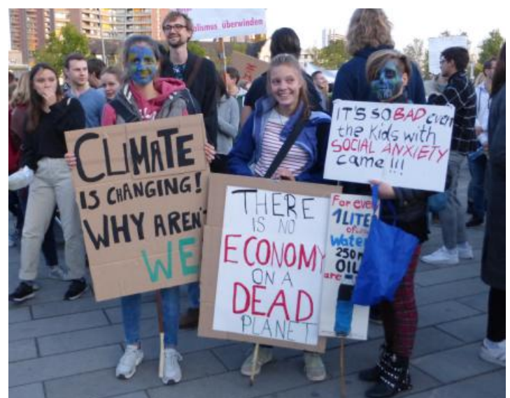
FFF-Demo am 20. September 2020 in Mannheim.