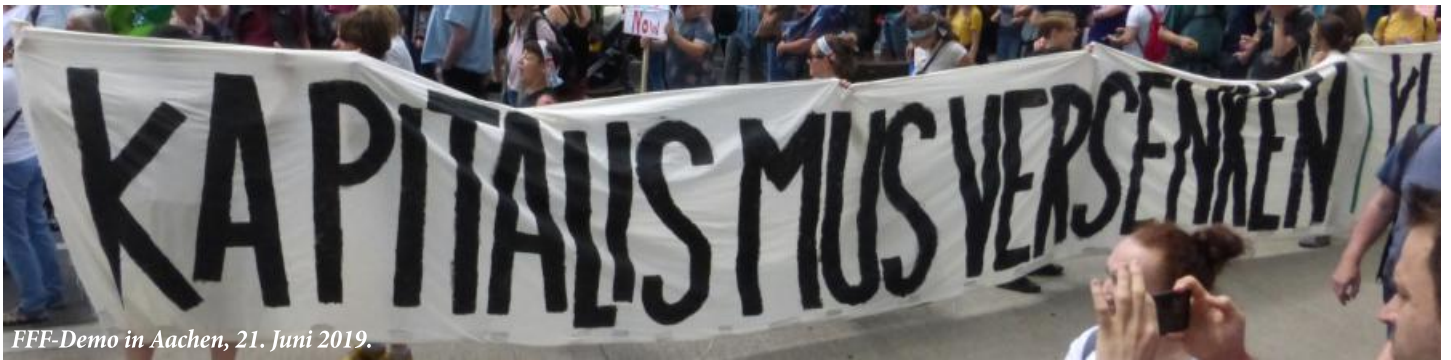
FFF-Demo in Aachen, 21. Juni 2019.

Der Weltklimarat (Intergovernmental Panel on Climate Change, IPCC) hat seinen Bericht über die physikalischen Grundlagen als Beitrag zum sechsten Sachstandsbericht über den Klimawandel vorgelegt, der Anfang 2022 erscheinen soll. Der Bericht und seine Zusammenfassung sind in dem präzisen Stil und dem Wortschatz wissenschaftlicher Veröffentlichungen gehalten, die „objektive“ Aussagen machen. Aber noch nie hat ein Bericht von Expert*innen für die globale Erwärmung einen solchen Eindruck von den Ängsten vermittelt, die durch die Abwägung der Fakten im Lichte der unumstößlichen Gesetze der Physik entstehen.