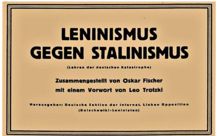
Broschüre der LO von 1933.

Als im Frühjahr 1930 die Gründung der Linken Opposition der KPD – trotz der Bekämpfung durch den stalinistischen Geheimdienst GPU – gelang, verstärkten die Führungen von SPD,