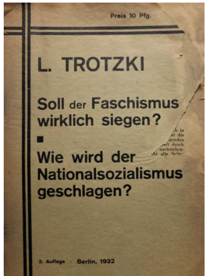
Broschüre der LO von 1932.

Deshalb konnte die Vereinigte Linke Opposition der K.P.D. (Bolschewiki-Leninisten) (VLO) erst am 30. März 1930 in