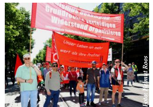
DGB-Demo in Mannheim, 1. Mai 2025.

Gegen Klassenkampf von oben hilft nur aktive Solidarität von unten. ■