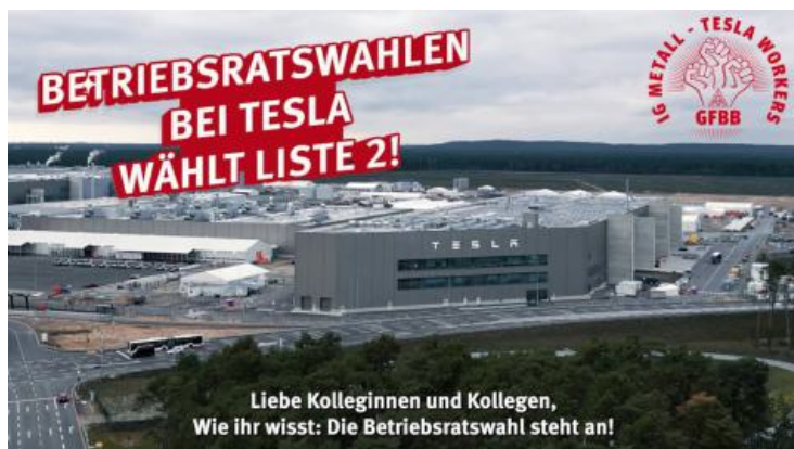
Wahlwerbung der IGM bei Tesla Grünheide, 2024.

Diese und andere Ergebnisse deuten auf eine zunehmende Entfremdung vieler Kolleg:innen von ihren meist dem „Co-Management“ sich verpflichtend fühlenden bisherigen betrieblichen Interessenvertretungen hin. Zudem spielen berechnete Existenzängste wegen der profitorientierten „Transformation“ zum Elektroantrieb in der Auto- und der Autozulieferindustrie eine große Rolle.