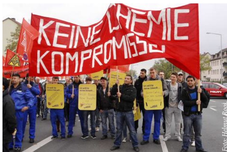
Protest bei Alstom Power in Mannheim, 2. November 2010.

Umso wichtiger ist es, jetzt in den Betrieben und Gewerkschaften für eine aktive und kämpferische Politik im Interesse der Beschäftigten einzutreten. Nur mit einem solchen Kurswechsel kann es gelingen, die Klasseninteressen der Arbeitenden zu verteidigen und die autoritäre Rechte zurückzudrängen. ■