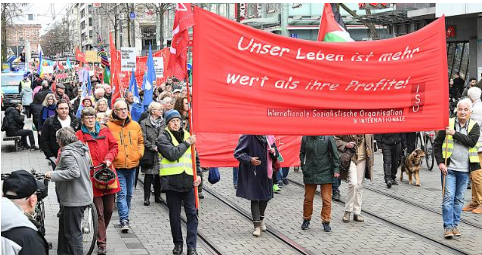
Ostermarsch in Mannheim, 4. April 2026.

Wir brauchen eine neue Welt ohne Monster. Also müssen wir diese neue Welt bauen. Sonst kommt sie nicht.“ ■