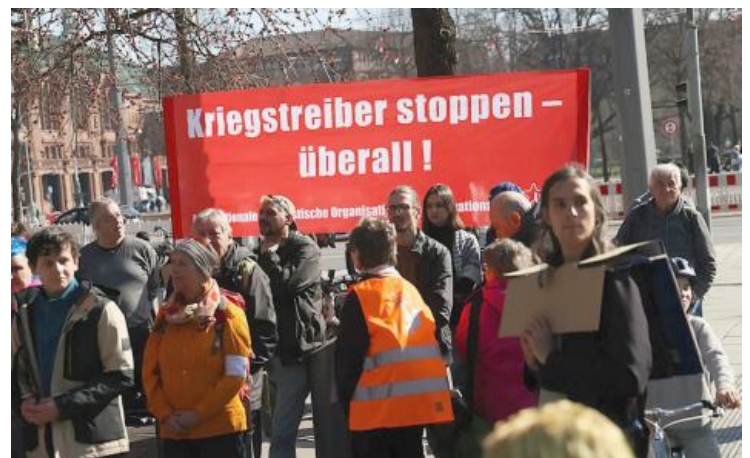
Schulstreik in Mannheim, 5. März 2026.

Um Aufrüstung und Kriegstreiberei stoppen zu können, bedarf es einer starken, international vernetzten antimilitaristischen Bewegung. Gewerkschaften, Klimagerechtigkeitsbündnisse, soziale und politische Organisationen müssen sich dieser Aufgabe stellen. Konkret gilt es jetzt, die Schulstreiks am 8. Mai 2026 zu unterstützen. ■