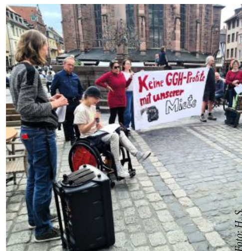
Mietenprotest in Heidelberg, 16. April 2026.