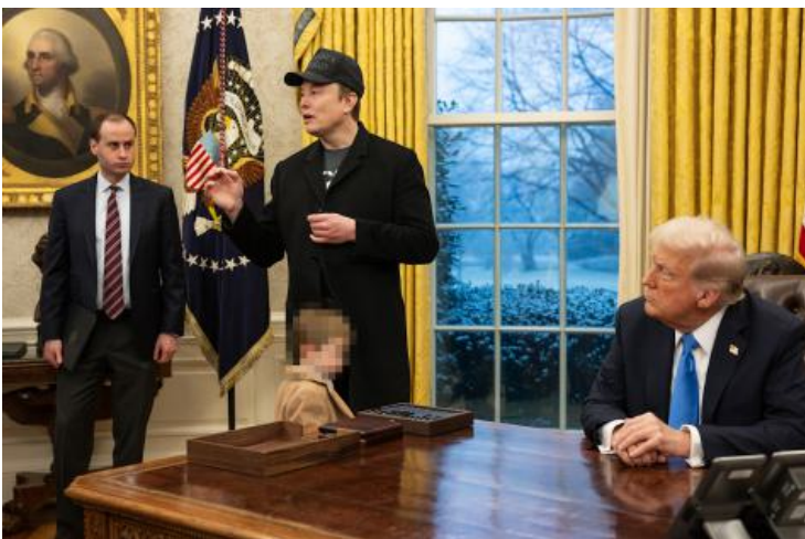
Musk und Trump im Weißen Haus, 11. Februar 2025.

Noch ist nichts entschieden. Noch ist Zeit – nutzen wir sie. ■