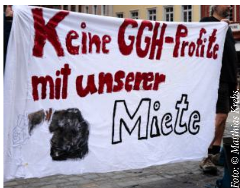
Mietenprotest in Heidelberg, 16. April 2026.

D ie Mieter:inneninitiative Höllenstein + Mark-Twain-Village bemerkt dazu: „In dem GGH-Dreiklang ‚sozial – ökologisch – wirtschaftlich‘ gibt die Wirtschaftlichkeit offensichtlich den Ton an – das heißt, die Gewinnsteigerung auf Kosten der Mieter:innen“.